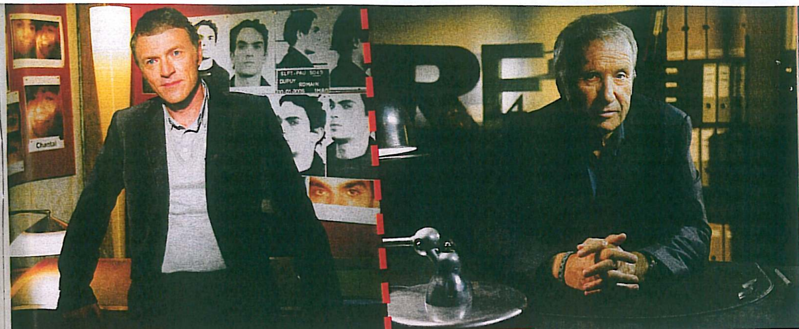
FAITES ENTRER L'ACCUSÉ Concept original, le magazine de Christophe Hondelatte, sur France 2, est une des émissions de faits divers les plus copiées.