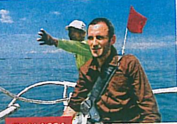
THALASSA Pour se renouveler, le magazine de France 3 a regardé attentivement celui de Canal+...