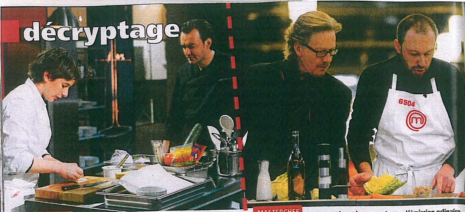
TOP CHEF M6 a dégainé en premier avec plusieurs programmes culinaires, dont celui-ci, qui a rencontré un succès d'audience.