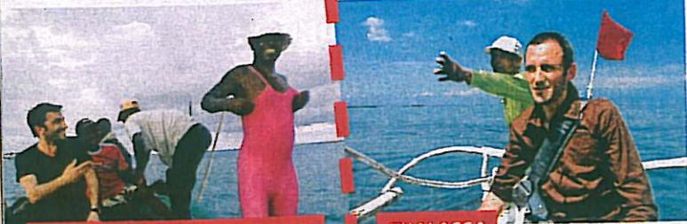
LES NOUVEAUX EXPLORATEURS Si Canal+ n'a rien inventé, les autres s'en sont inspirés.

autre monde sur W9, 100% Immersion sur Direct 8... Gageons que ce n'est pas terminé. Toujours sur Direct 8, Ma vie est un clone de C'est ma vie sur M6, lui-même inspiré de Toute une histoire sur France 2 : en gros, sur les problèmes de santé, de sexe, d'amour ou de couple de M. et M me Tout-le-Monde. Et que dire des émissions de reportage – 90' Enquêtes sur TMC, Enquête d'action sur W9, Tellement vrai sur NRJ 12... – qui suivent, au choix, la BAC du 93, la police des autoroutes ou les pompiers de Paris ? Pas grand-chose si ce n'est que c'est toujours pareil ! Dans le même ordre d'idées, on a renoncé à faire le compte des enfants illégitimes de Faites entrer l'accusé ... Est-ce que Présumé innocent passe bien sur Direct 8, à moins que ce ne