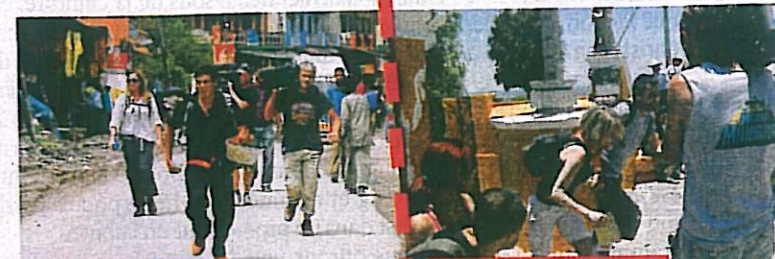
PÉKIN EXPRESS Action, aventure, paysages grandioses... L'émission phare de M6 a démarré au quart de tour.